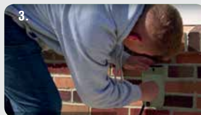
3. Conecte-se à fonte de alimentação.