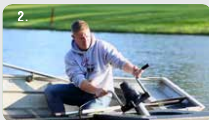
2. Insira o conjunto do motor no flutuador.