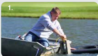
1. Ancore o flutuador.*